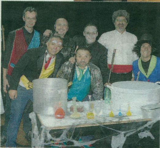
CAST Gli artisti del 2° Galà di Magia che hanno animato lo show del Teatro Villoresi